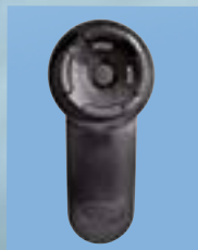
3 + 4