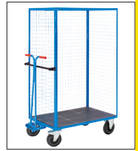
Mit Zugdeichselset (Zubehör)