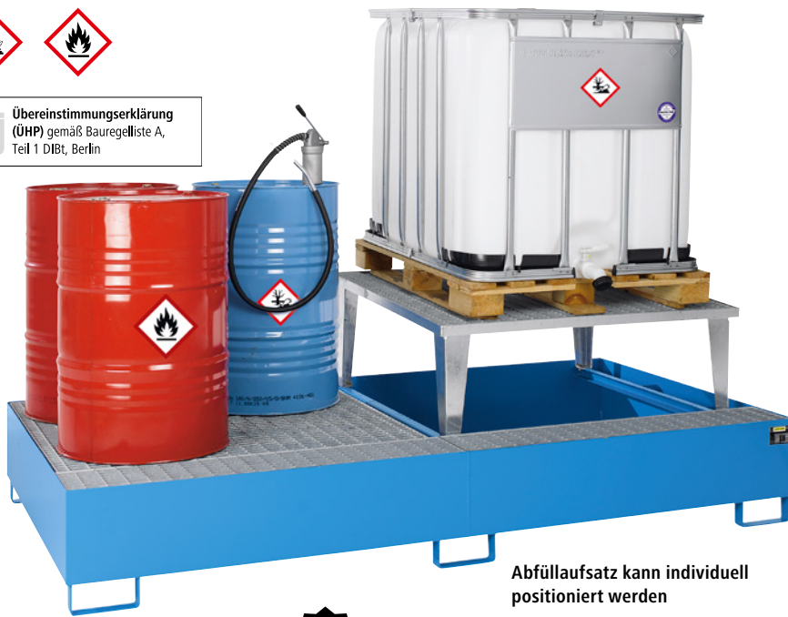
Abfüllaufsatz kann individuell positioniert werden

Ü Übereinstimmungserklärung (ÜHP) gemäß Bauregelleiste A, Teil 1 DIBt, Berlin