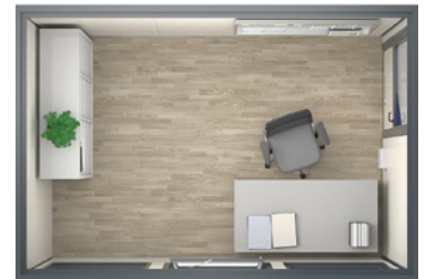
2600 x 3605 x 2455 mm