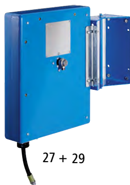
27 + 29