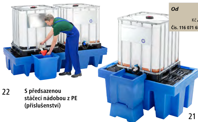
22 S předseznenou stáčenou nádobou z PE (příslušenství)

U Povolení stavebního dozoru DiBt, Berlín (Německý institut pro stavební techniku)