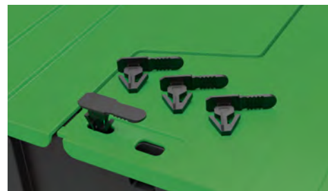
Vhodné plomby jako příslušenství