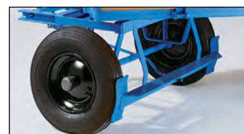
Sériově se zajišťovací brzdou