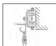
Posuvné zařízení před překladem