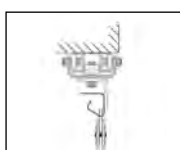
Posuvné zařízení pod překladem