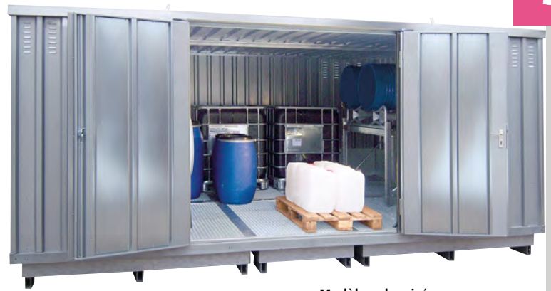
20 Modèle galvanisé

Matériau: Acier profilé. Modèle de plancher: cuve de rétention galvanisée à chaud avec caillebotis, charge max. admissible 1000 kg/m 2 pour un poids uniformément réparti. Verrouillage: serrure de sécurité. Surface: galvanisé. Type de porte: portes à 2 battants. Hauteur porte: 1900 mm. Label: homologation générale de surveillance de construction (DiBt). Classes de produits dangereux: pour le stockage actif de matières inflammables des classes GHS 1 – 3.