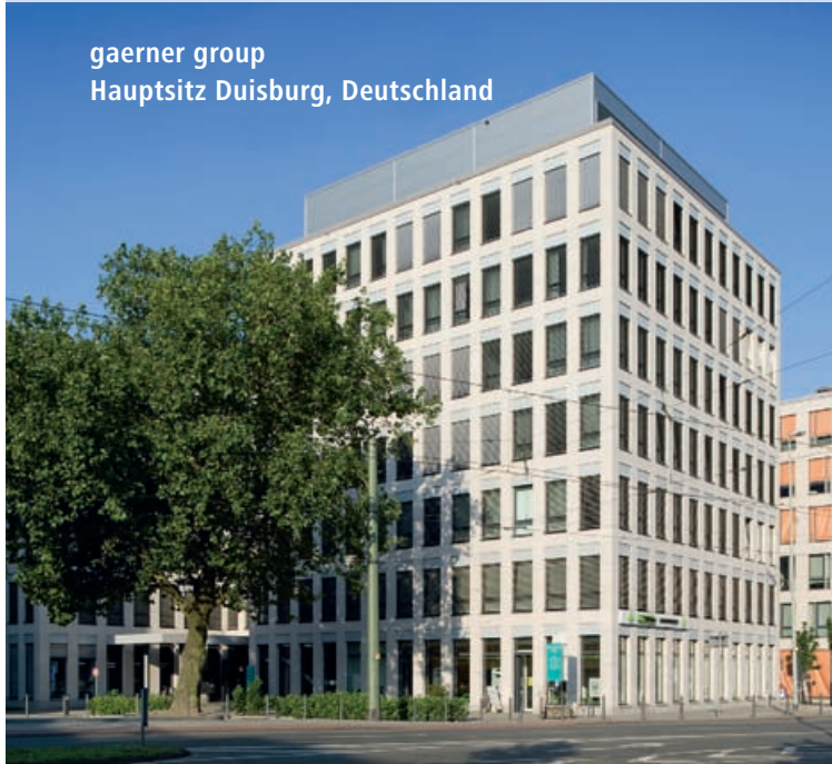
gaerner group Hauptsitz Duisburg, Deutschland