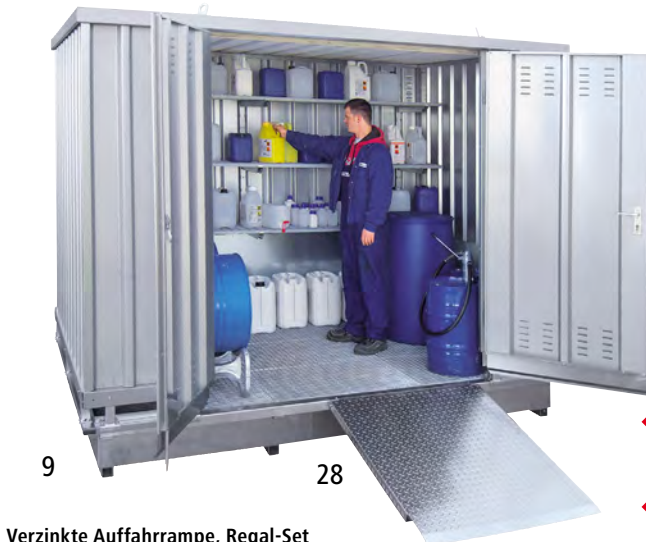
Verzinkte Auffahrrampe, Regal-Set (Zubehör)

Gefahrstoff-Brandschutzcontainer bitte anfragen.