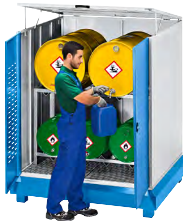
Mit Fassregal (Zubehör)