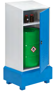
Mit Fachboden (Zubehör)