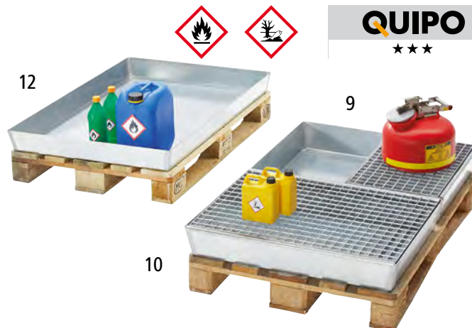
Mit Stahlgitterrost (Zubehör), ohne EUR-Palette

U Übereinstimmungserklärung (ÜHP) gemäß Bauregelliste A, Teil 1 DIBt, Berlin