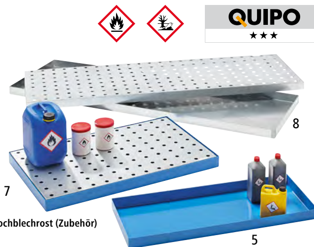
Mit Lochblechrost (Zubehör)

U Übereinstimmungserklärung (ÜHP) gemäß Bauregelliste A, Teil 1 DIBt, Berlin