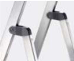
1 + 2 Holmumgreifendes Gelenksystem