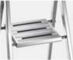
2 Plattform mit Anti-Rutsch-Streifen