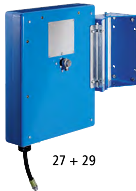
27 + 29