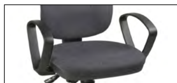
Mit Standard-Armlehnen (Zubehör)