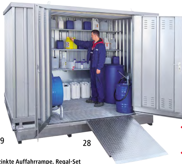
Verzinkte Auffahrrampe, Regal-Set (Zubehör)

Die Entladestelle muss mit LKW-Anhängerzug erreichbar sein.