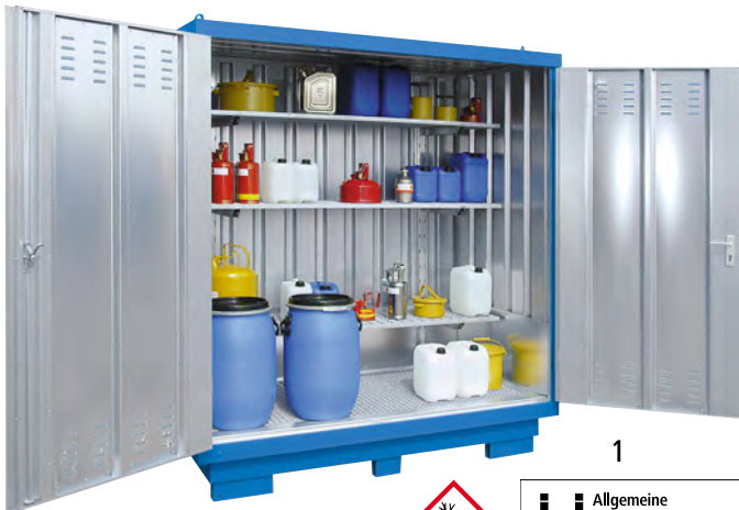
Außenwandlackierung (Mehrpreis), Regal-Set (Zubehör)

Gefahrstoff-Brandschutzcontainer bitte anfragen.