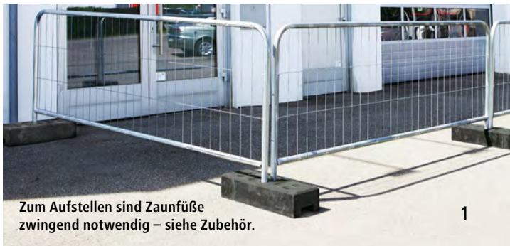
Zum Aufstellen sind Zaunfüße zwingend notwendig – siehe Zubehör.