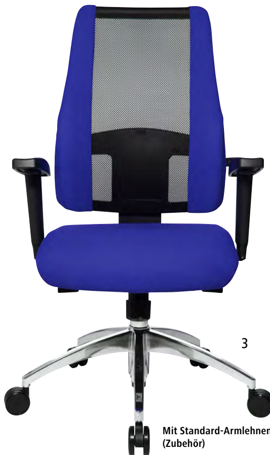
Mit Standard-Armlehnen (Zubehör)