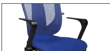
Mit Standard-Armlehnen (Zubehör)