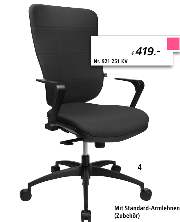
Mit Standard-Armlehnen (Zubehör)