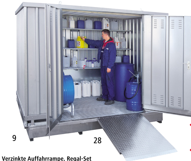
Verzinkte Auffahrrampe, Regal-Set (Zubehör)

Gefahrstoff-Brandschutzcontainer bitte anfragen.