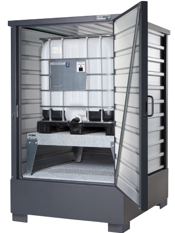
11 Mit IBC-Abfüllaufsatz (Zubehör)