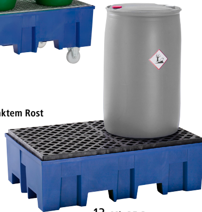
13 Mit PE-Rost