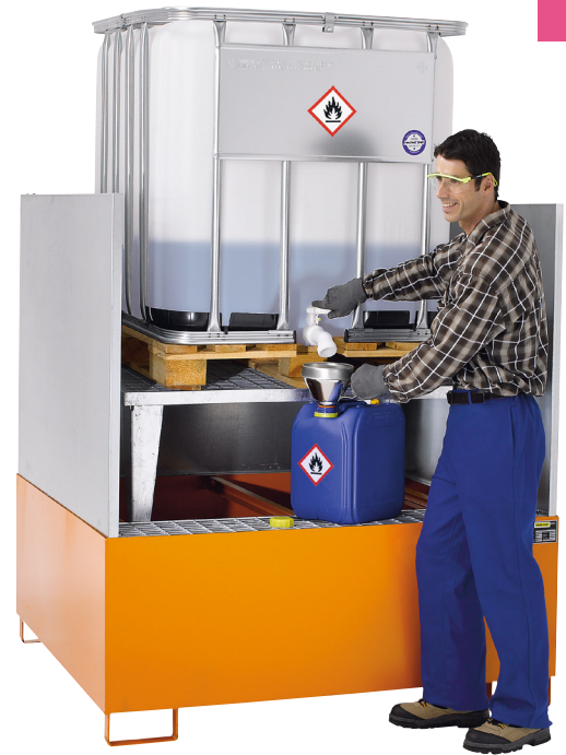
Mit Spritzschutzwänden (Zubehör)