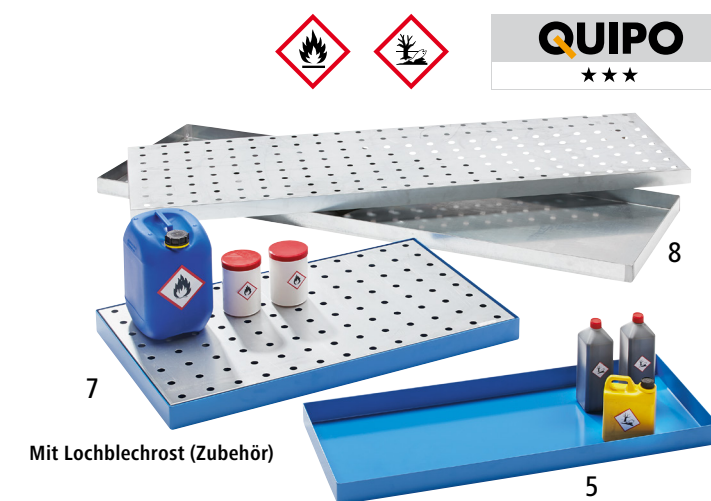
Mit Lochblechrost (Zubehör)