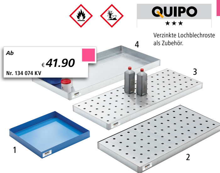
Mit Lochblechrost (Zubehör)