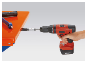
Schnelle Höhenverstellung mit dem Akkuschauber