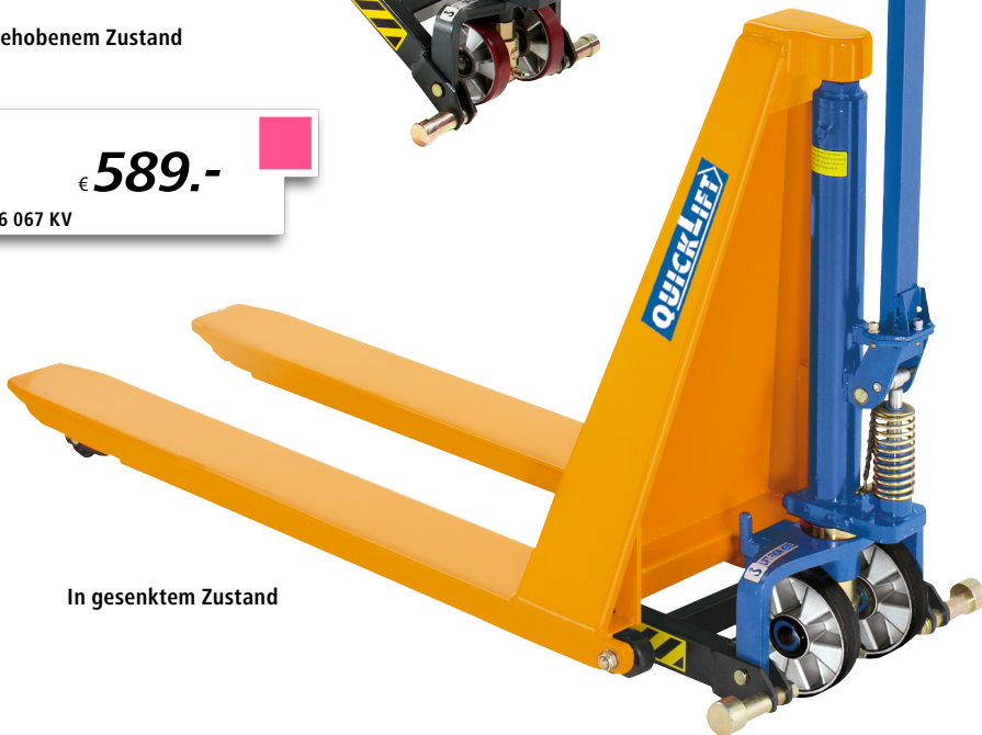
In gesenktem Zustand

Fahrbar bis Hubhöhe: 400 mm. Lenkradmaterial: Polyurethan. Lastrollenmaterial: Polyurethan. Lastrollenausführung: Single. Lastrollendurchmesser: 75 mm. Oberfläche: pulverbeschichtet. Eigenschaft: manuell / mobil. Ausstattung: QuickLift.