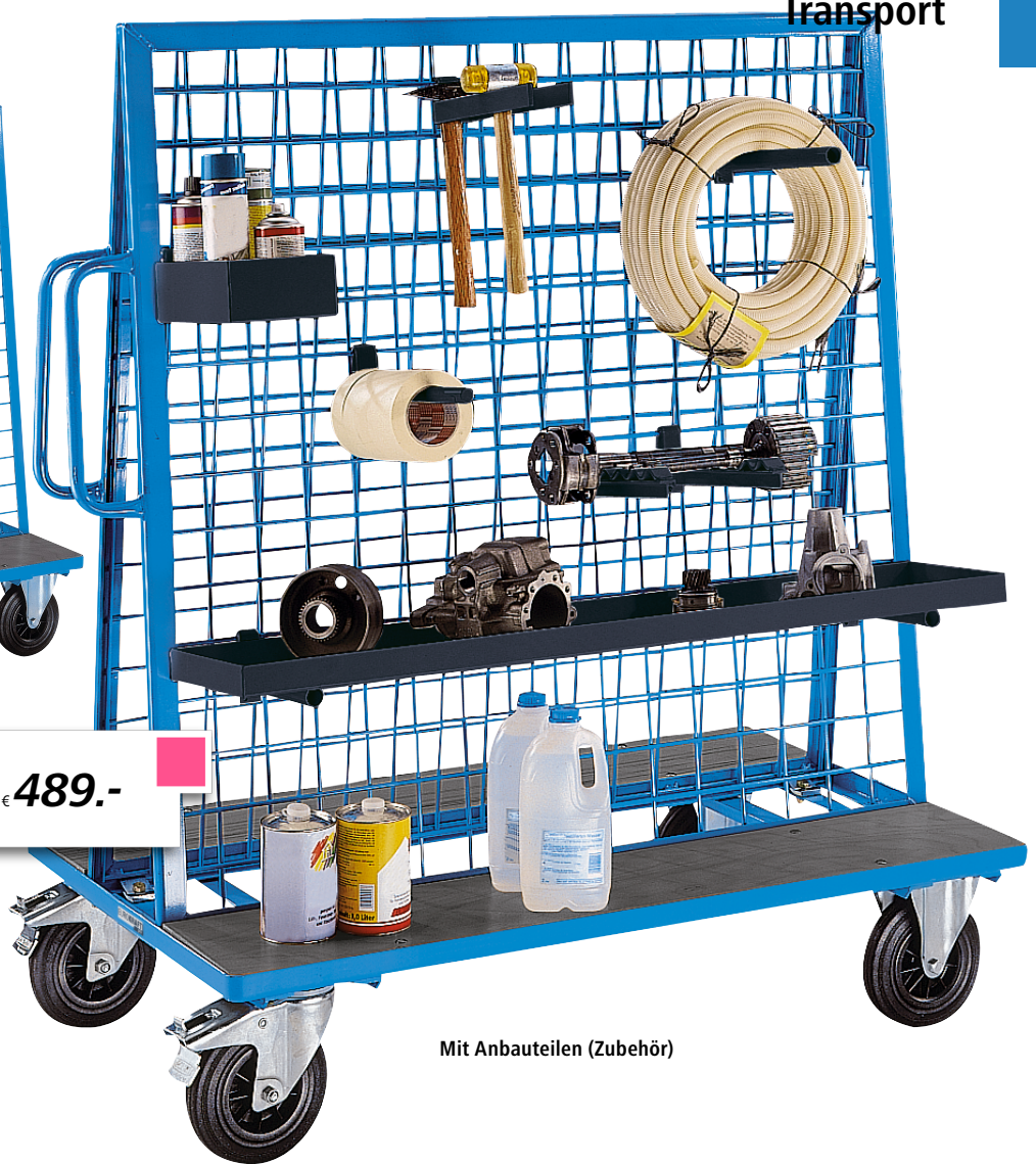
Mit Anbauteilen (Zubehör)