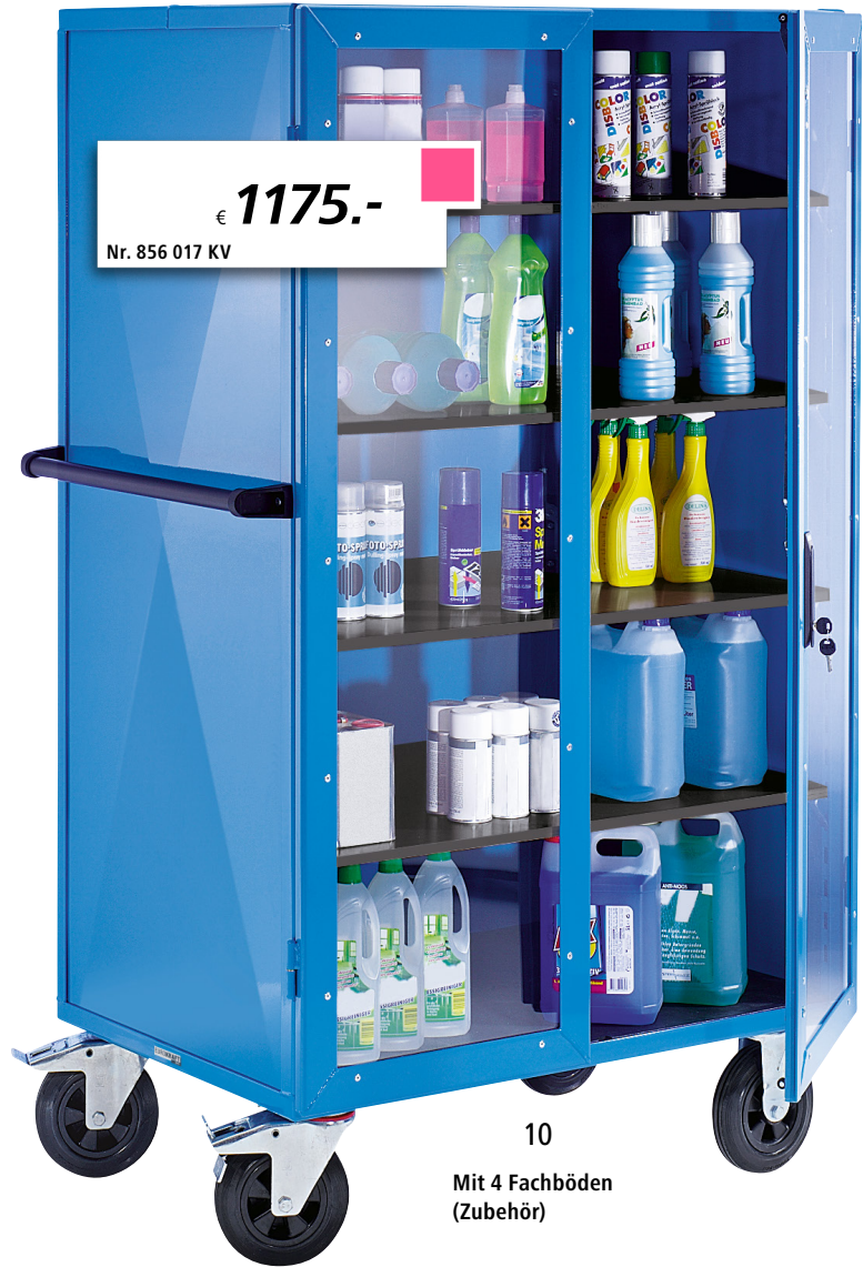
10 Mit 4 Fachböden (Zubehör)