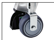
Mit vier lastabhängigen Bremsrollen