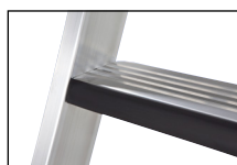
Mit gepolsterten Stufenvorderkanten