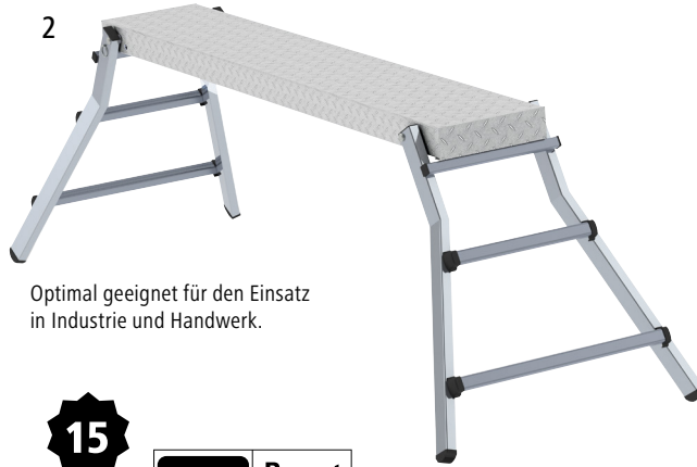
Optimal geeignet für den Einsatz in Industrie und Handwerk.