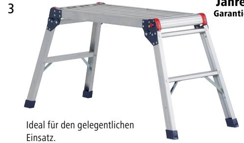
Ideal für den gelegentlichen Einsatz.