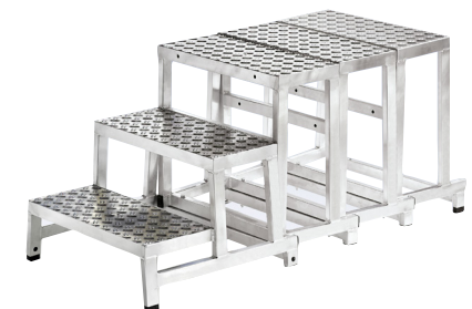
Grundmodule + 3 x Modul 2