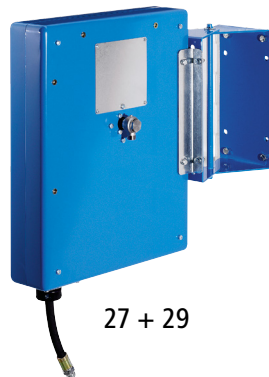
27 + 29