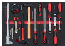
18 Set Universalwerkzeuge