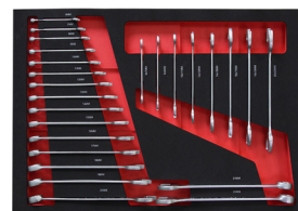
20 Set Ring-/Gabelschlüssel