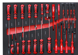
19 Set Schraubendreher