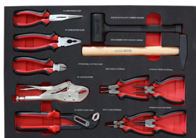
17 Set Zangen/Hammer