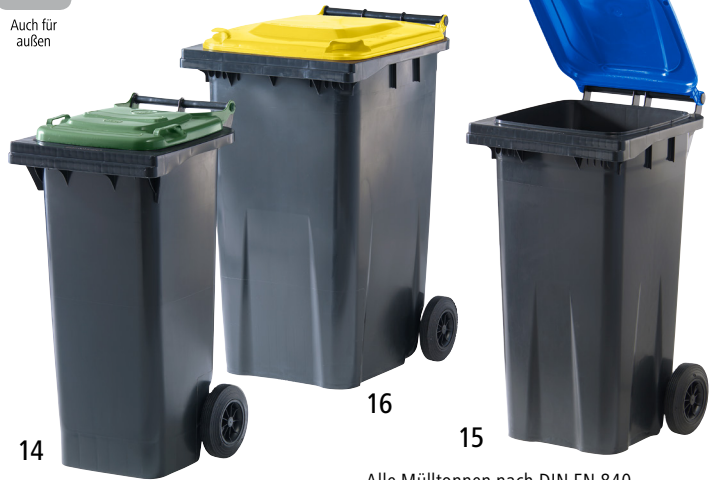
Alle Mülltonnen nach DIN EN 840.