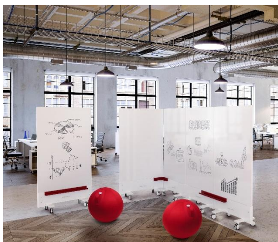
Ergonomisch, mobil und flexibel einsetzbar sollten Möbel und Arbeitsutensilien im Office sein.

„In diesen Zeiten entwickeln sich Büros immer mehr zu einem Ort der Begegnung, in dem gemeinsames Arbeiten im Fokus steht“, sagt Puhalj. Um die Gesundheit der Mitarbeiter:innen auch dort zu schützen, hat KAISER+KRAFT beispielsweise Bürodrehstühle , Whiteboards und Garderobenschränke im Sortiment, die durch ihre antibakterielle Oberfläche die Entstehung und Ausbreitung von Bakterien verhindern. So