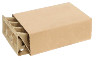
[L-Box terra 3] Die umweltfreundliche L-Box terra bietet Industriewaren den optimalen Schutz beim Versand.

Pliening, 05.05.2023: Die neu entwickelte Fixierverpackung L-Box terra, derzeit exklusiv erhältlich beim Verpackungsspezialisten ratioform, ist die nachhaltige Alternative zu herkömmlichen Schaumstoff-Verpackungen. Die spezielle Box ist aus einer umweltfreundlichen Faserformmatte hergestellt, kann zu 100 % im Altpapier recycelt werden und bietet weitere nachhaltige Vorteile für Unternehmen.