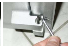
Image n° 5