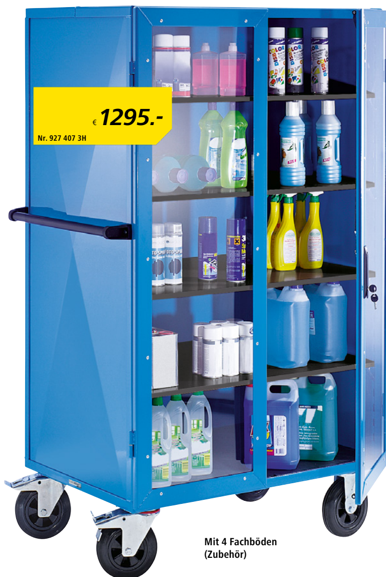
Mit 4 Fachböden (Zubehör)