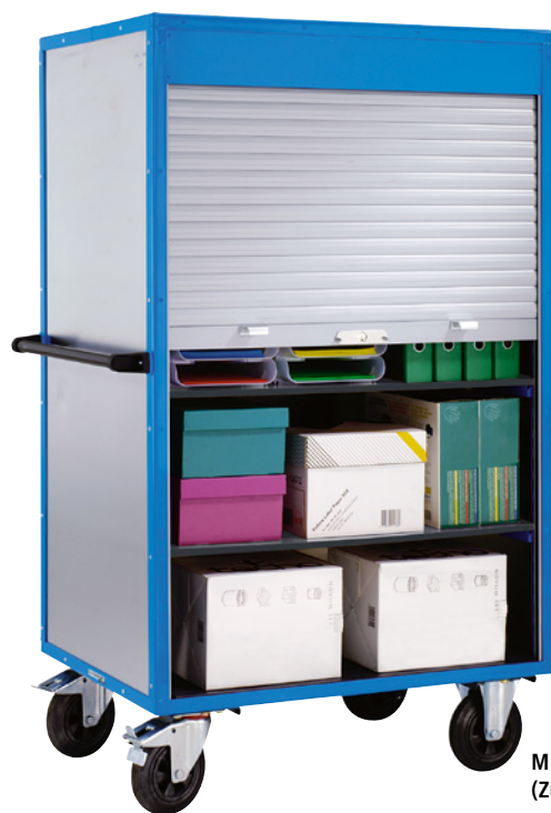
Mit 3 Fachböden (Zubehör)