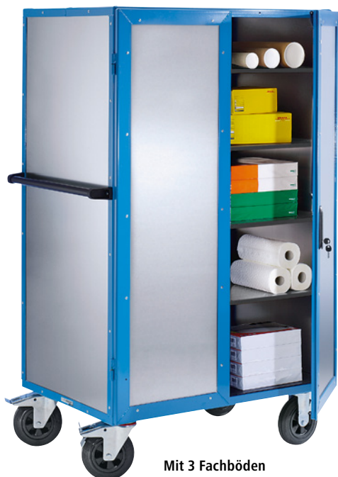
Mit 3 Fachböden (Zubehör)